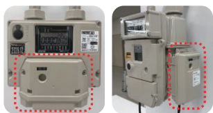
一体型無線機 外付け型無線機