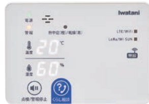
ゲートウェイ本体